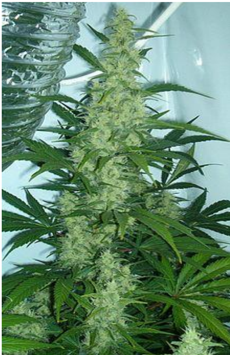
kvetoucí rostlina konopí