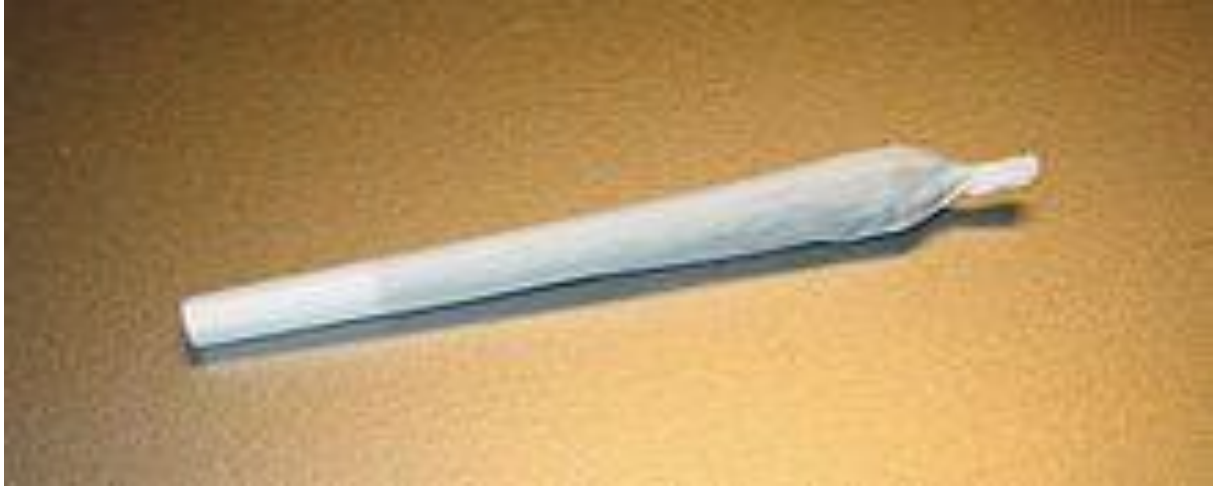
Marihuanová cigareta - joint