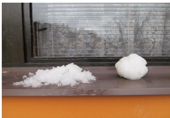
Obr. 6. Pokus

Čím více sněh uplácáš, tím pomaleji taje. Schválně zkus dát na okno hromádku sněhu a vedle ní uplácanou sněhovou kouli. Až začne svítit sluníčko, uvidíš, co roztaje první.