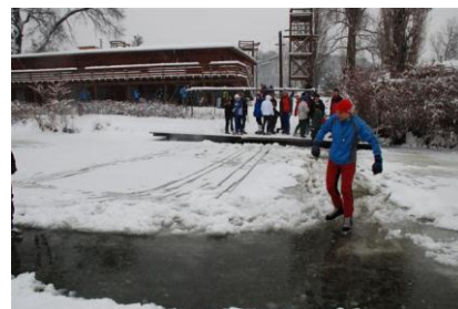
Obr. 7. Zimní sporty

Nakresli, jakou zábavu na sněhu máš nejrady ty: