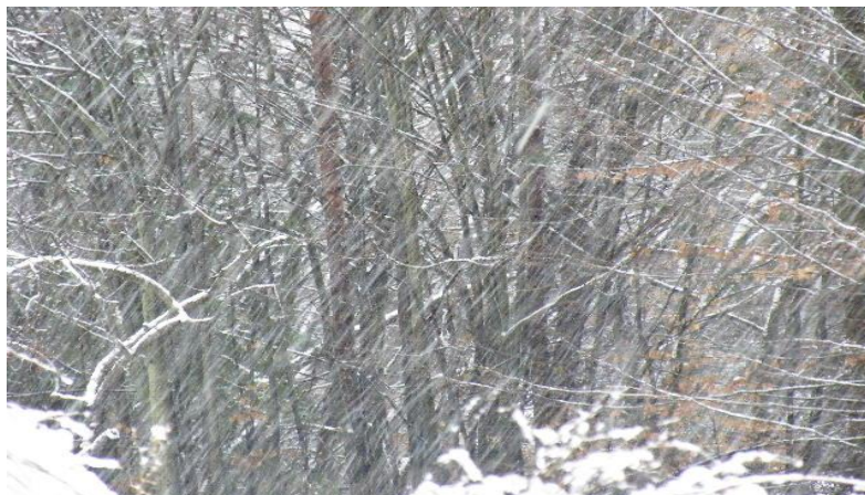
Obr. 1. Sněží

„Sněží!“ vykřikl Pavlík, sotva se ráno vzbudil, a už utíkal ze schodů. Kdyby ho maminka nezadržela, byl by vyběhl ven ještě v pyžamu. „Nastydl bys a byl bys nemocný,“ řekla mu.