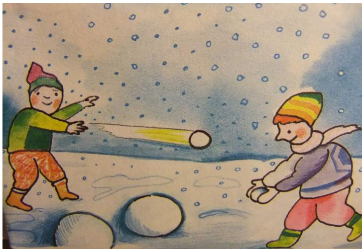
Obr. 5. Sněhové koule

Čím více sněh uplácáš, tím pomaleji taje. Schválně zkus dát na okno hromádku sněhu a vedle ní uplácanou sněhovou kouli. Až začne svítit sluníčko, uvidíš, co roztaje první.