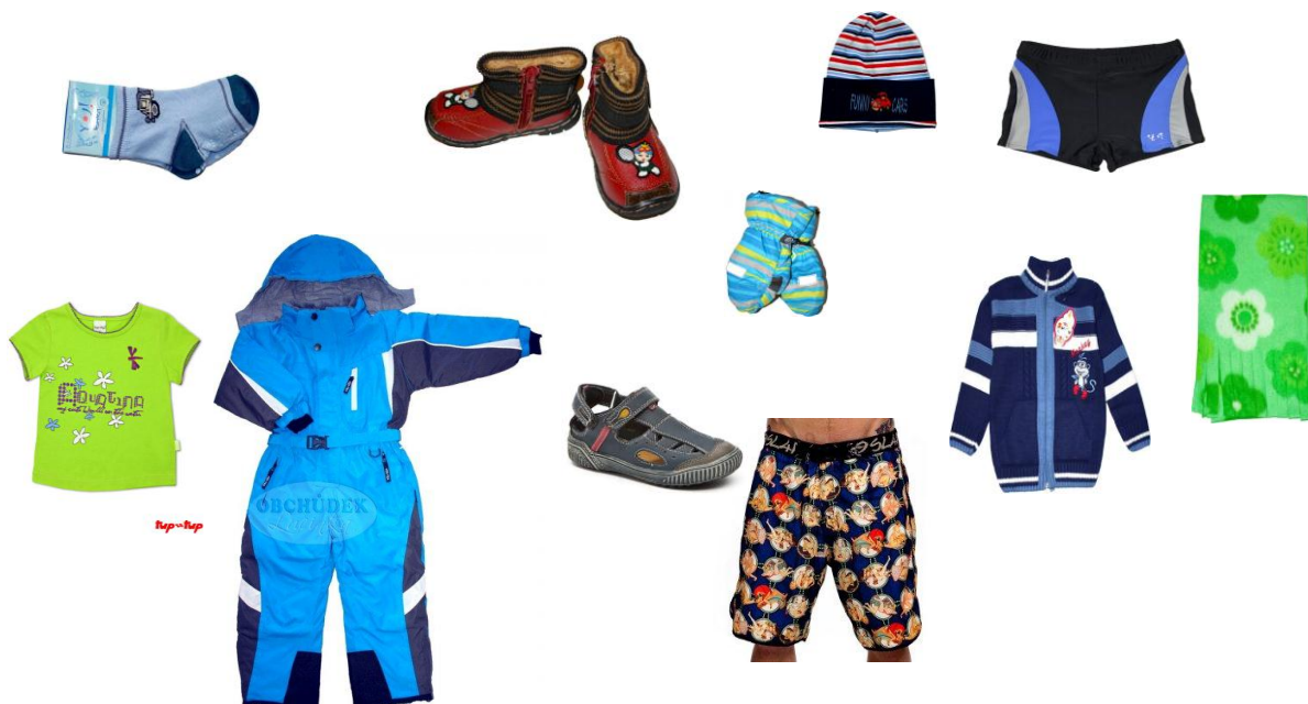
Obr. 2 Oblečení

Výber oblečení, které si Pavlík asi oblékl: