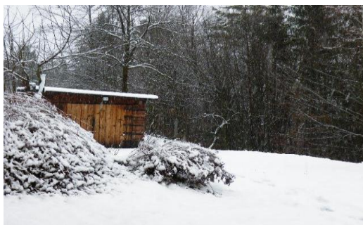
Obr. 3. Plno sněhu

Všude bylo plno sněhu a další pořad padal.