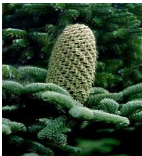
4. Jedlové šiška