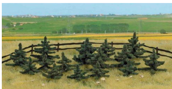
26. Lesní školka

„Kdyby člověk stromy jenom kácel, tak by jich opravdu ubývalo. Proto by měl za každý pokácený strom vysadit několik nových.“