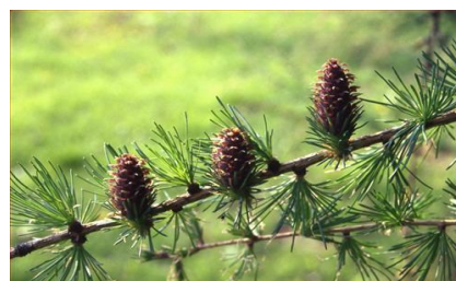
12. Modřínové šišky

Děti si ještě chvíli hrály a pak se společně s rodiči vydali na zpáteční cestu. Anička stále vybírala ty nejkrásnější listy, které našla, ale Pavlíkovi začalo hlavou vrtat něco jiného.