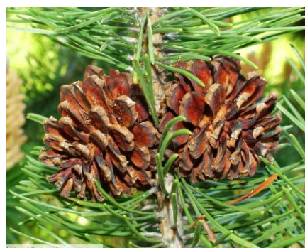
9. Borovicové šišky

A pokud najdete strom, kterému na zimu jehličí opadá, tak to bude nejspíše modřín.“