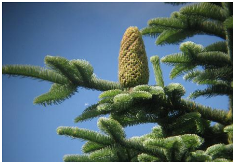
5. Jedlová šiška