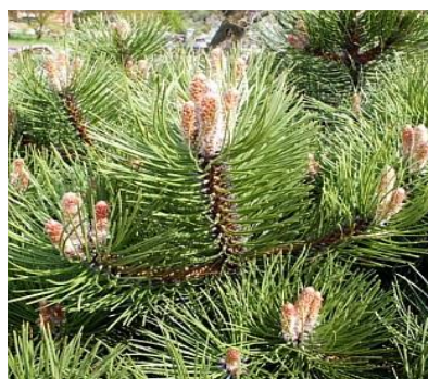
8. Větvička borovice