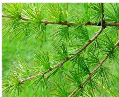
11. Větvičky modřínu