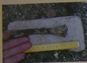
Železná votivní noha