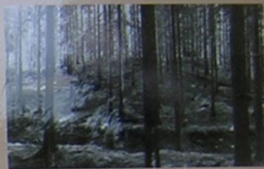
Páhorek s kostelem v roce 1985

Zaniklý pozdně románský kostel o protáhlé hlavní lodi s pravoúhlým presbytářem vyrostl na skalním výchozu poblíže průsmyku na staré cestě ze Sokolova do Lokte. Zanikající stavbu v minulosti nesčetněkrát překopalo mnoho hledačů pokladů. Přesto však výzkum našel bohatý archeologický materiál (keramika, sklo, drobné kovové předměty, kosterní pozůstatky aj.) jež nám poskytly cenné informace o jeho existenci.