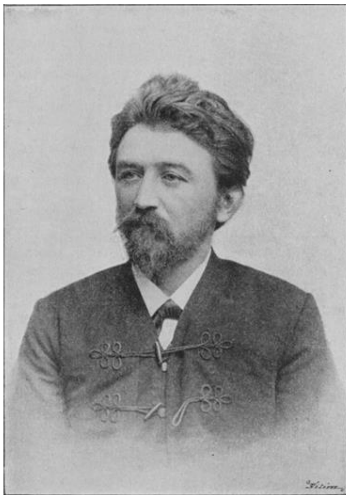
KAREL V. RAIS.