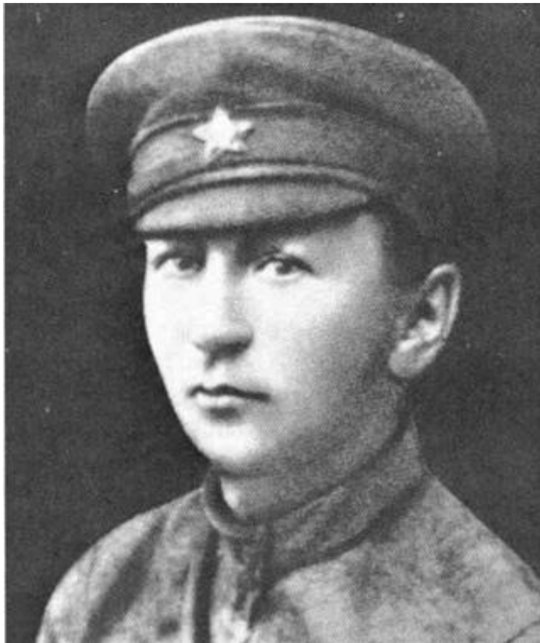
Jaroslav Hašek v rudoarmějské uniformě