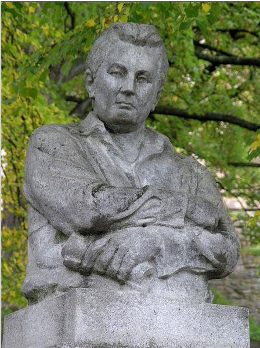
pomník v Lipnici nad Sázavou