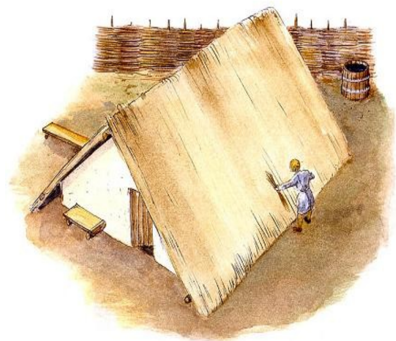
Skutečná raně středověká

Prohlédni si obrázek slovanské chaty a zamysli se, proč se nazývá zemnice nebo polozemnice.