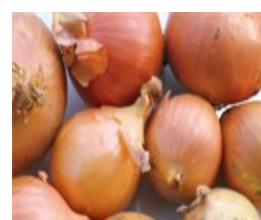
Obr. 10 Nápodvěda