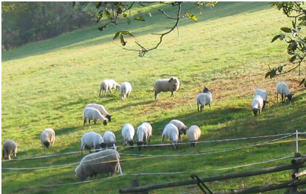
1. Stádo ovcí

O velikonočních prázdninách se rodiče i s dětmi vydali na návštěvu ke strýci na statek. Strýc měl kromě spousty polí, na kterých pěstoval brambory a jinou zeleninu, také stádo ovcí, jednu krávu a dva koně.