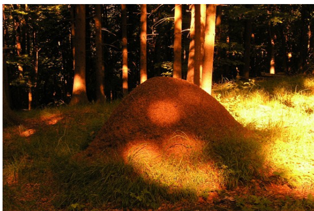
Obr. 2 Mraveniště

„Dávejte pozor, ať je nezašlápnete,“ nabádal je dědeček. „A když budete opatrní, můžete se jít se mnou podívat sem na kraj. Tady mají mraveniště.“