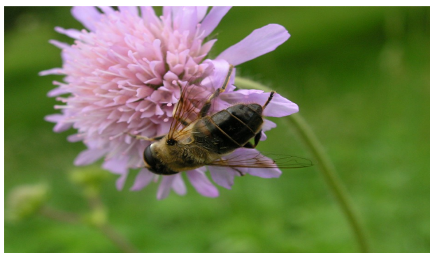
Obr. 5 Včely

„Ale kdeže,“ zasmál se dědeček, „domku, kde žijí včely se říká úl. I z něj každé ráno vylétá spousta pracantů, kterým se u včelek říká dělnice, a shánějí jídlo. Poletují od květiny ke květině a z každé si upijí trochu nektaru.“