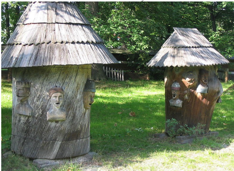
Obr. 4 Včelí úly

„Ale kdeže,“ zasmál se dědeček, „domku, kde žijí včely se říká úl. I z něj každé ráno vylétá spousta pracantů, kterým se u včelek říká dělnice, a shánějí jídlo. Poletují od květiny ke květině a z každé si upijí trochu nektaru.“