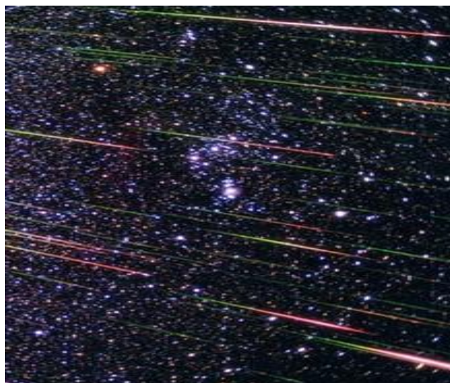
meteorická tělesa, prach, plyn