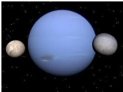
planety a měsíce