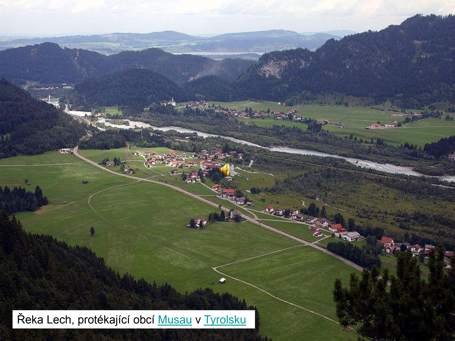
Řeka Lech, protékající obcí Musau v Tyrolsku