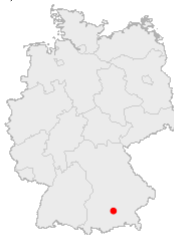
Mnichov (München) 4