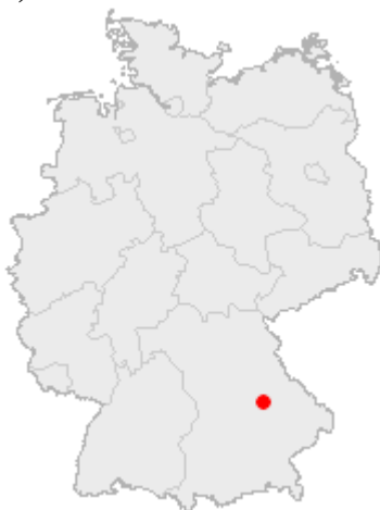
Řezno (Regensburg) 3