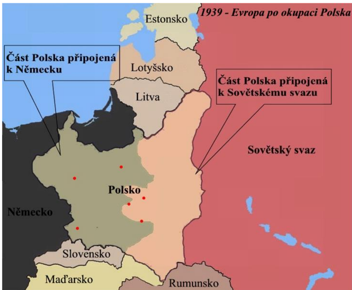
Mapa Územní vývoj Polska 4,5 – upravená mapa 6

4. Na mapě níže jsou vyznačeny vyhlazovací koncentrační tábory tak, jak jsou uvedeny ve výchozím textu. Pokus se je správně umístit. Které z těchto táborů plnily i funkci koncentračního tábora. K řešení můžeš použít internetové zdroje. Se souhlasem učitele můžeš také použít atlas.