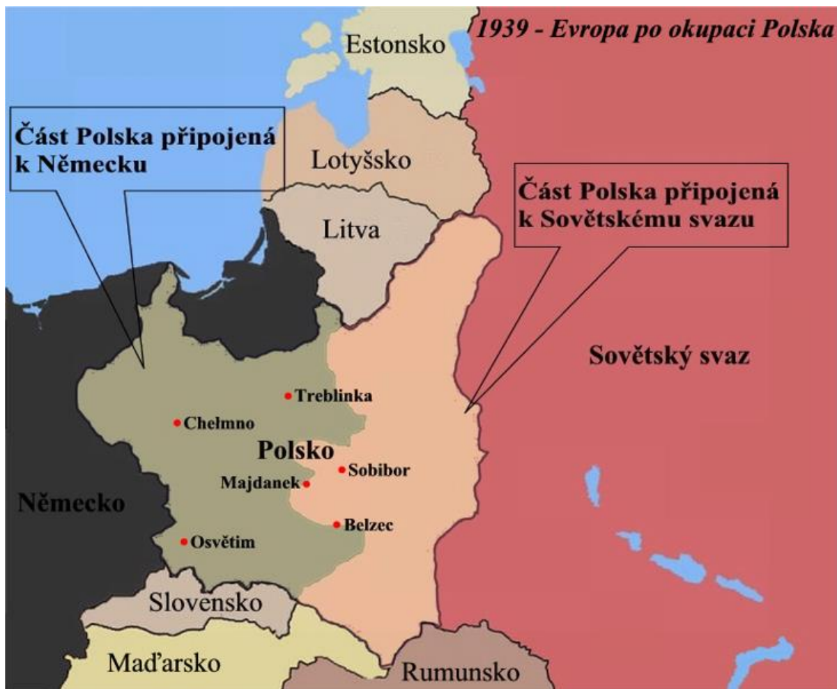
Mapa Územní vývoj Polska 4,5 – upravená mapa 7

5. Pokus se určit na základě textu níže, o jaký vyhlazovací tábor jde. Náповěda – jde o tábor, který je jako druhý (v Polsku) nejbližší České republice.