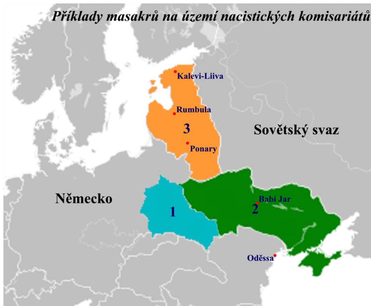
Mapa Příklady masakrů na území nacistických komisariátů 4,5,6 – upravená mapa 16

4. Následující texty popisují některé z mnoha masakrů na území nacistických komisariátů v Sovětském svazu. Pokus se je situovat do níže zobrazené mapy. Dále specifikuj původce těchto masakrů a jejich oběti.