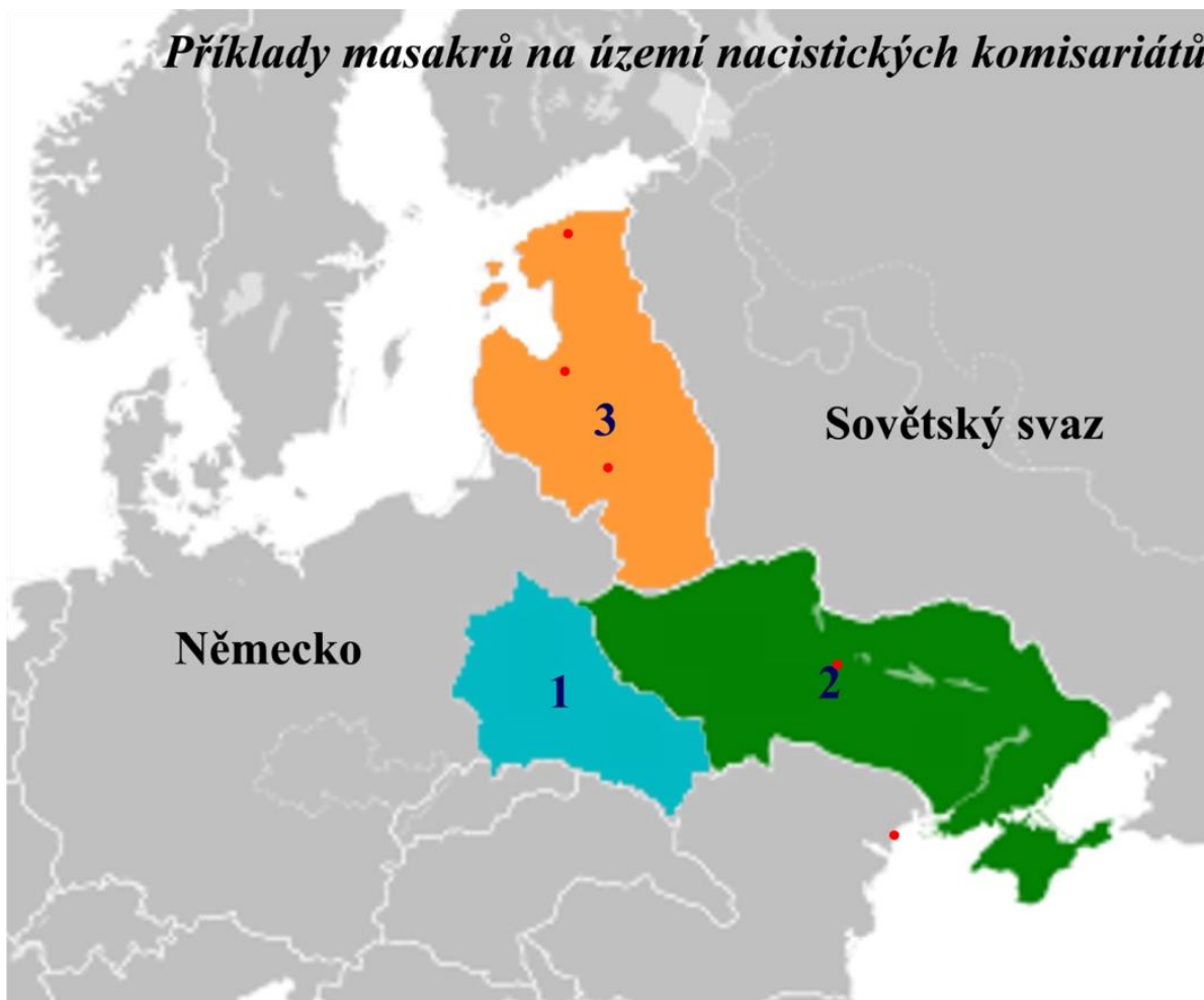
Mapa Příklady masakrů na území nacistických komisariátů 4,5,6 – upravená mapa 13