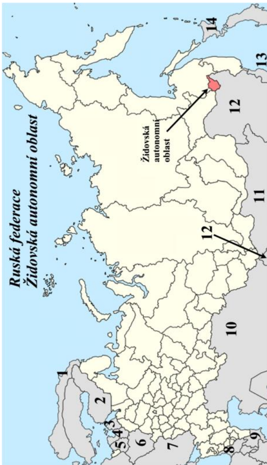
Mapa Ruská federace / Židovská autonomní oblast 3 – upravená mapa 4