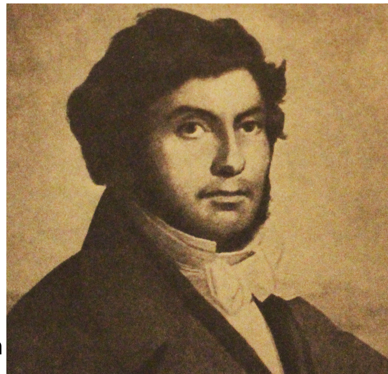
Obr.5 Jean-Francois Champolion