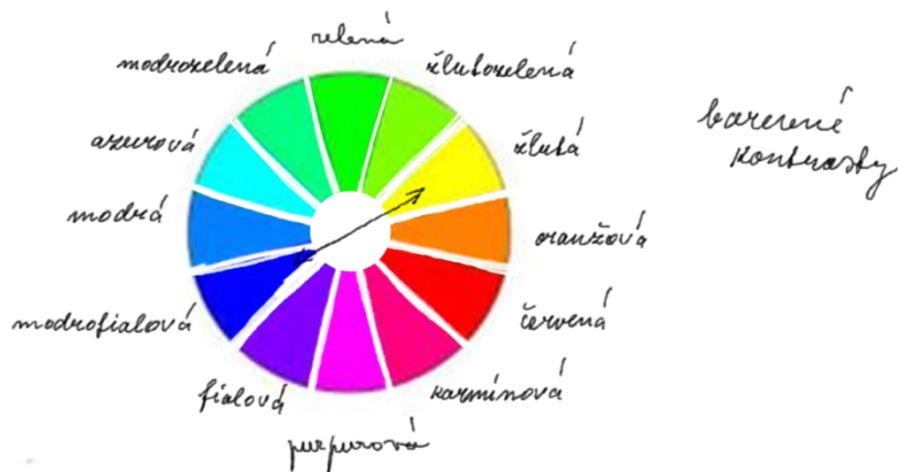
Obrázek č. 1-vlastní kresba autorky