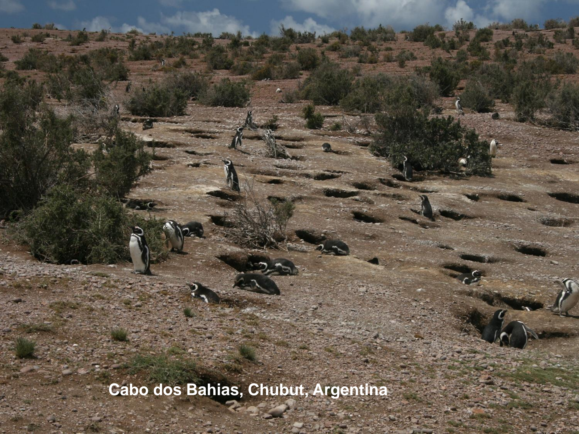
Cabo dos Bahias, Chubut, Argentina