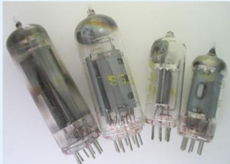
Obr. 1. - Součástka počítače [1]

Přiřaďte k obrázkům správné označení součástek počítačů.