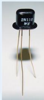
Obr. 2. - Součástka počítače [2]