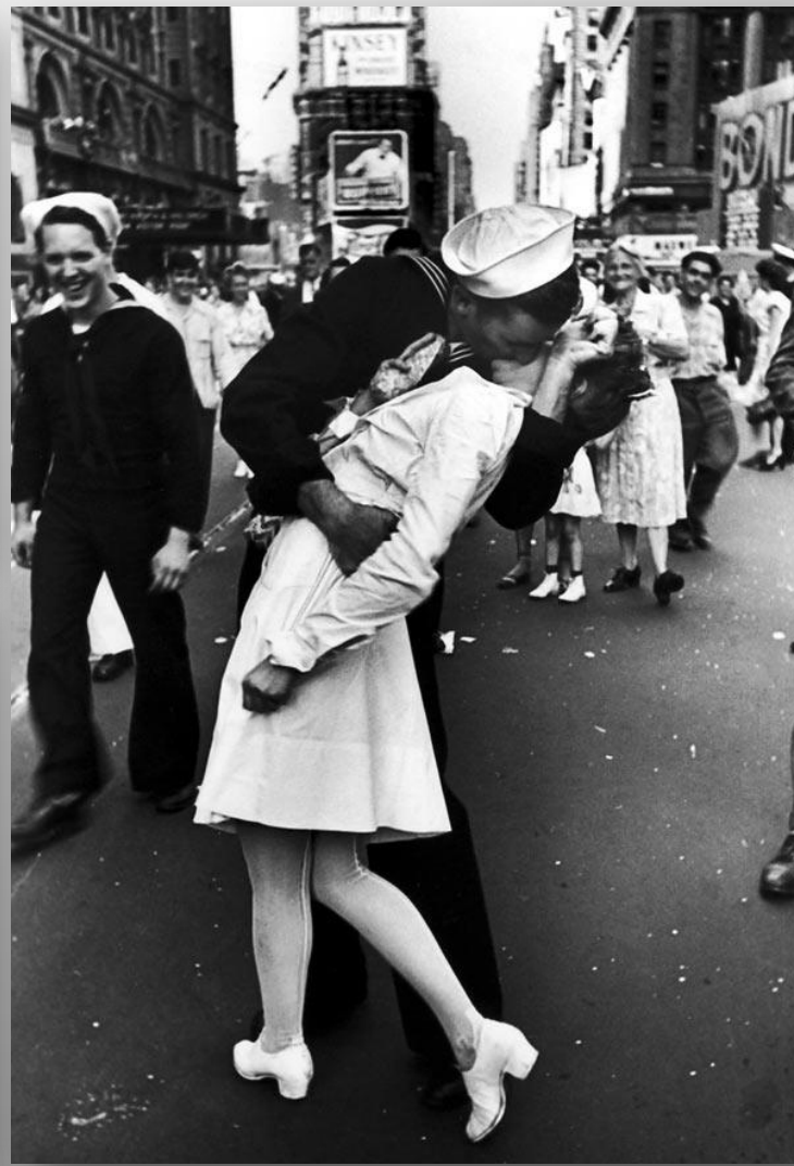
Celosvětově známá fotografie polibku na Times Square z roku 1945