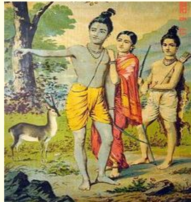
RAJA RAVI PRESS. Rama in forest.jpg [online]. [cit. 5. 9. 2012]. Dostupný na WWW: http://cs.wikipedia.org/wiki/Soubor:Rama_in_forest.jpg