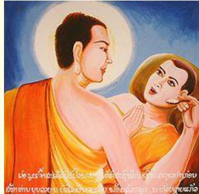
AUTOR NEUVEDEN. Nursing sick monk.jpg [online]. [cit. 5. 9. 2012]. Dostupný na WWW: http://cs.wikipedia.org/wiki/Soubor:Nursing_sick_monk.jpg