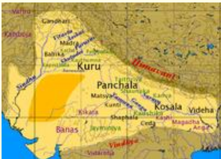
Map of Vedic India.png [online]. [cit. 5. 9. 2012]. Dostupný na WWW: http://cs.wikipedia.org/wiki/Soubor:Map_of_Vedic_India.png