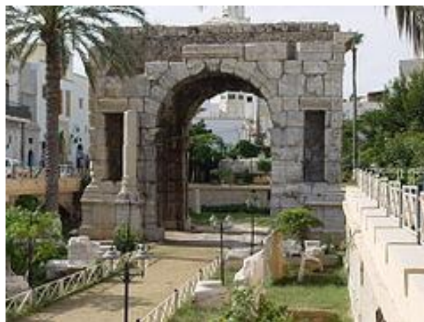
Markův vítězný oblouk v Tripolisu DANIEL AND KATE PETT. Marcus Aurelius Arch Tripoli Libya.jpgZ Wikipedie, otevřeně encyklopedie [online]. [cit. 1.9.2012]. Dostupný na WWW: http://cs.wikipedia.org/wiki/Soubor:Marcus_Au relius_Arch_Tripoli_Libya.jpg