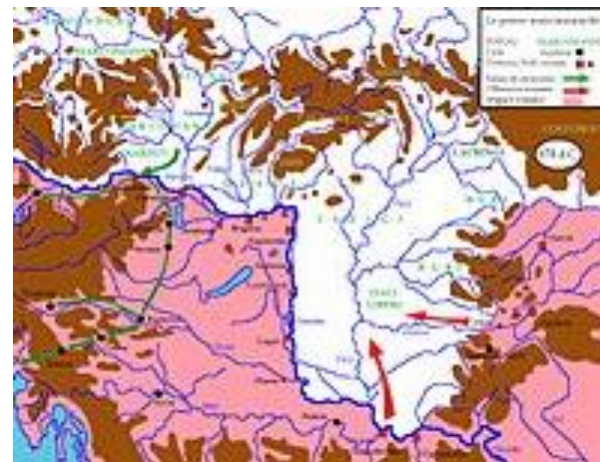
Invaze Markomanů a Kvádů do Itálie v roce 170 CRISTIANO64. Marcomannia e Sarmatia 170 dC.jpg.JPG [online]. [cit. 1.9.2012]. Dostupný na WWW: http://cs.wikipedia.org/wiki/Soubor:Marcom annia_e_Sarmatia_170_dC_jpg.JPG