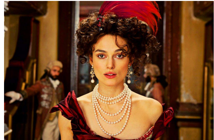
Anna Karenina – L.N. Tolstoj