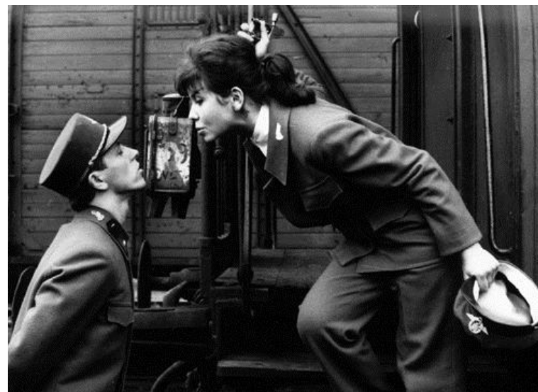
Ostře sledované vlaky – Bohumil Hrabal