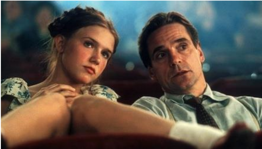
Lolita – V. Nabokov