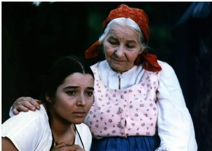
Babička – Božena Němcová