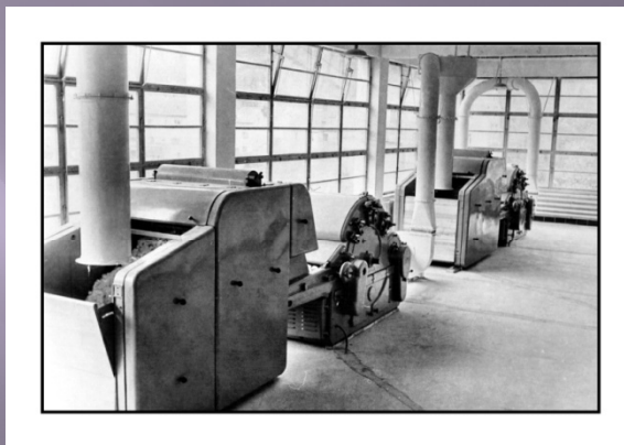
stroj na plstění