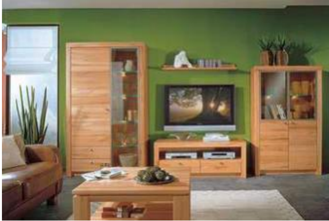
Describe living room.