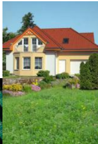
- family house