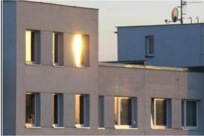
- block of flats