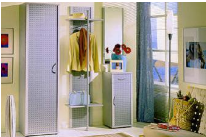
Describe hall and other rooms.