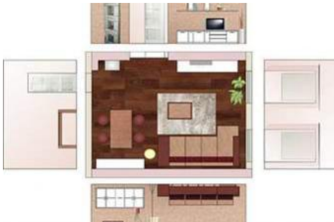
Plan of living room –describe inspiration.

Compare both room. Do you have a cloak-room?