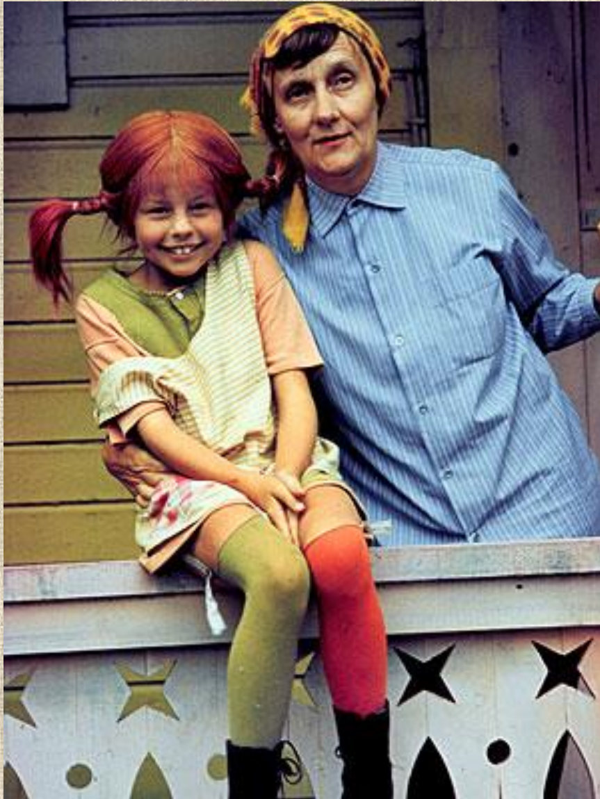
Astrid Lindgrenová (1907 - 2002)