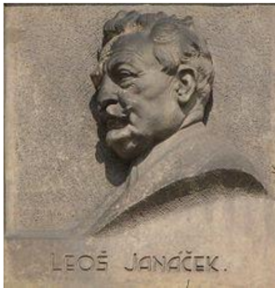
Reliéf Leoše Janáčka v Olomouci