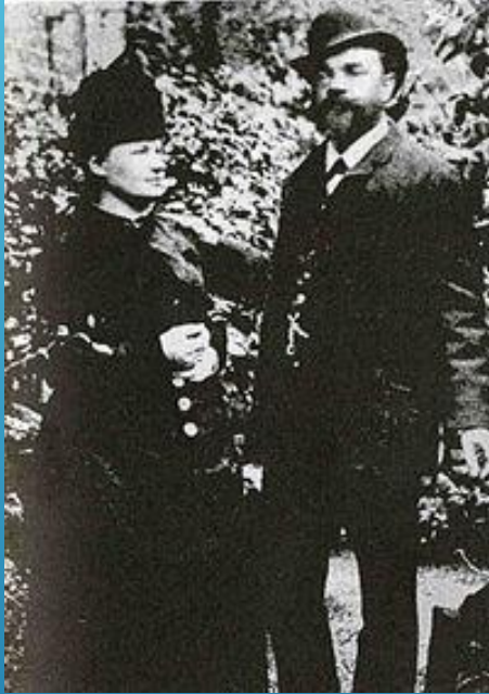
Dvořák s manželkou Annou v Londýně, 1886