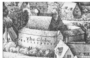
obr. 2 – The Globe Theatre, detail from Hollar's View of London , 1647.