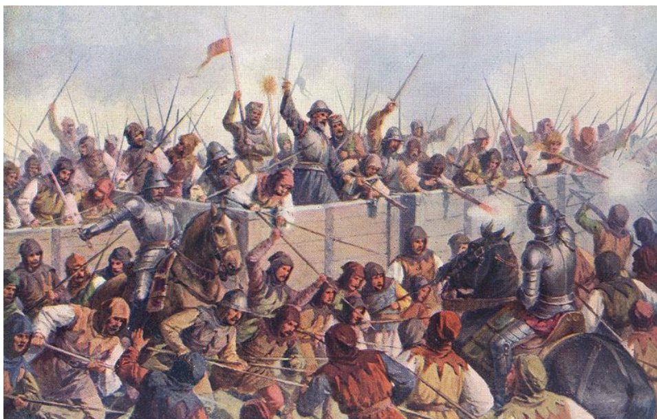
Bitva u Lipan .....

Autorem materiálu a všech jeho částí, není-li uvedeno jinak, je Mgr. Jan Pavlovský-Fiala. Materiál vznikl v OP Vzdělání pro konkurenceschopnost – projekt EU peníze školám.