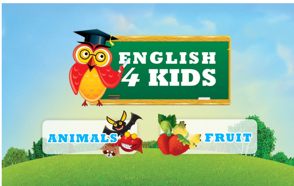
Obr. 1: Aplikace English4KIDS - úvod

Aplikace English4Kids je ideální pro výuku angličtiny na prvním stupni základní školy. Hlavním cílem aplikace je zábavné seznámení a procvičování slovní zásoby zvířat a ovoce. Aplikaci lze využít na tabletech jak při školní výuce, tak doma. Aplikaci lze zařadit na úvod hodiny jako vhodnou motivaci a seznámení se slovní zásobou a v další části hodiny jako procvičování formou hry, jež je doplněno přitažlivou hudbou. Děti mohou pracovat individuálně či skupinově formou soutěže.