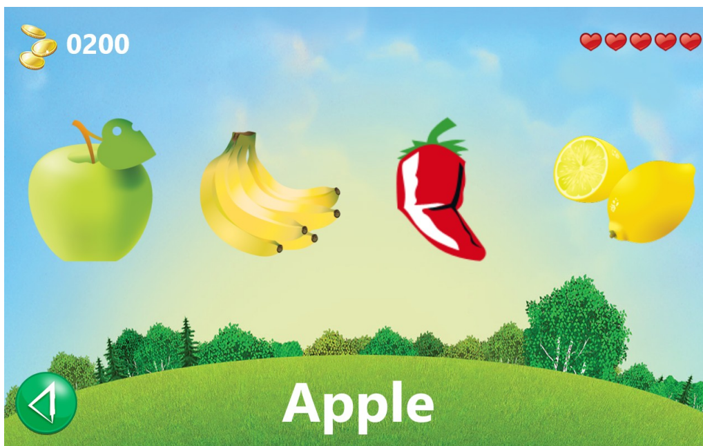
Obr. 3: Aplikace English4KIDS – ovoce