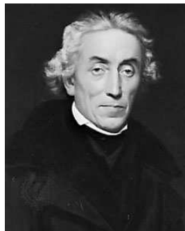
Obr. 1 Josef Dobrovský