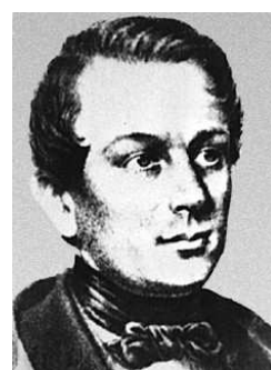
obr. 3 Josef Kajetán Tyl