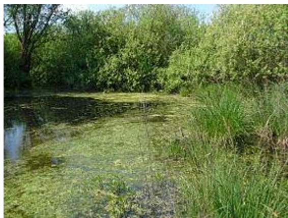
CHKO LITOVELSKÉ POMORAVÍ