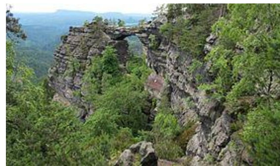
NP ČESKÉ ŠVÝCARSKO