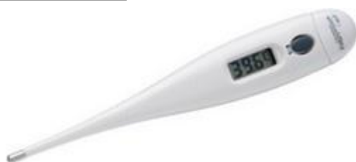
Digitální lékařský teploměr