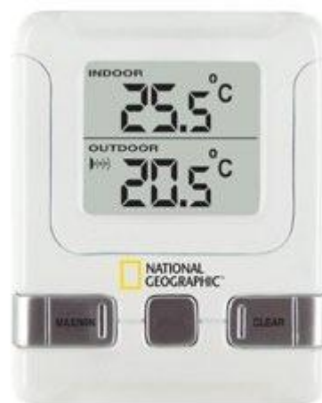
digitální venkovní / vnitřní teploměr