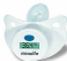
Digitální teploměr – dudlík