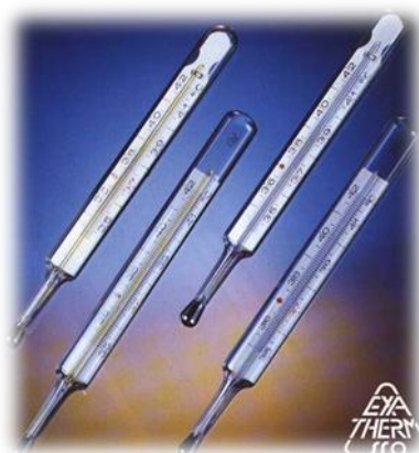
Rtuťový lékařský teploměr