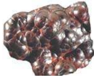
Krevel ( hematit )