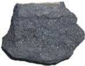
Magnetovec ( magnetit )