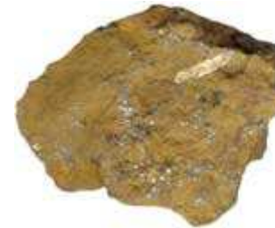
Hnědel ( limonit )