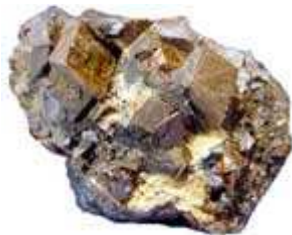
Ocelek ( siderit )