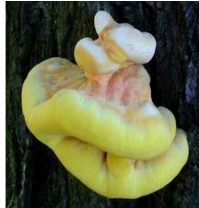
Dřevokazná houba Sírovec žlutooranžový