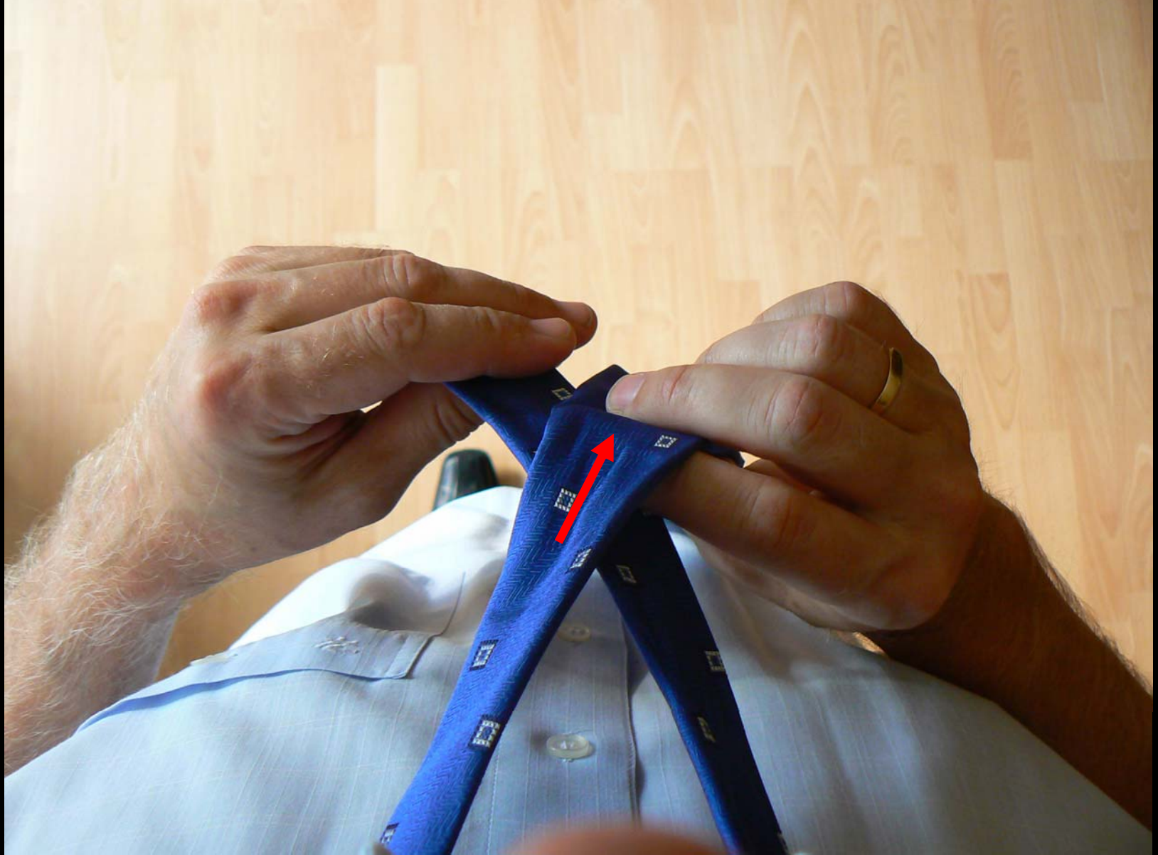
Uzel Manhattan - první překřížení, podpora pravou rukou (snímek č. 2)