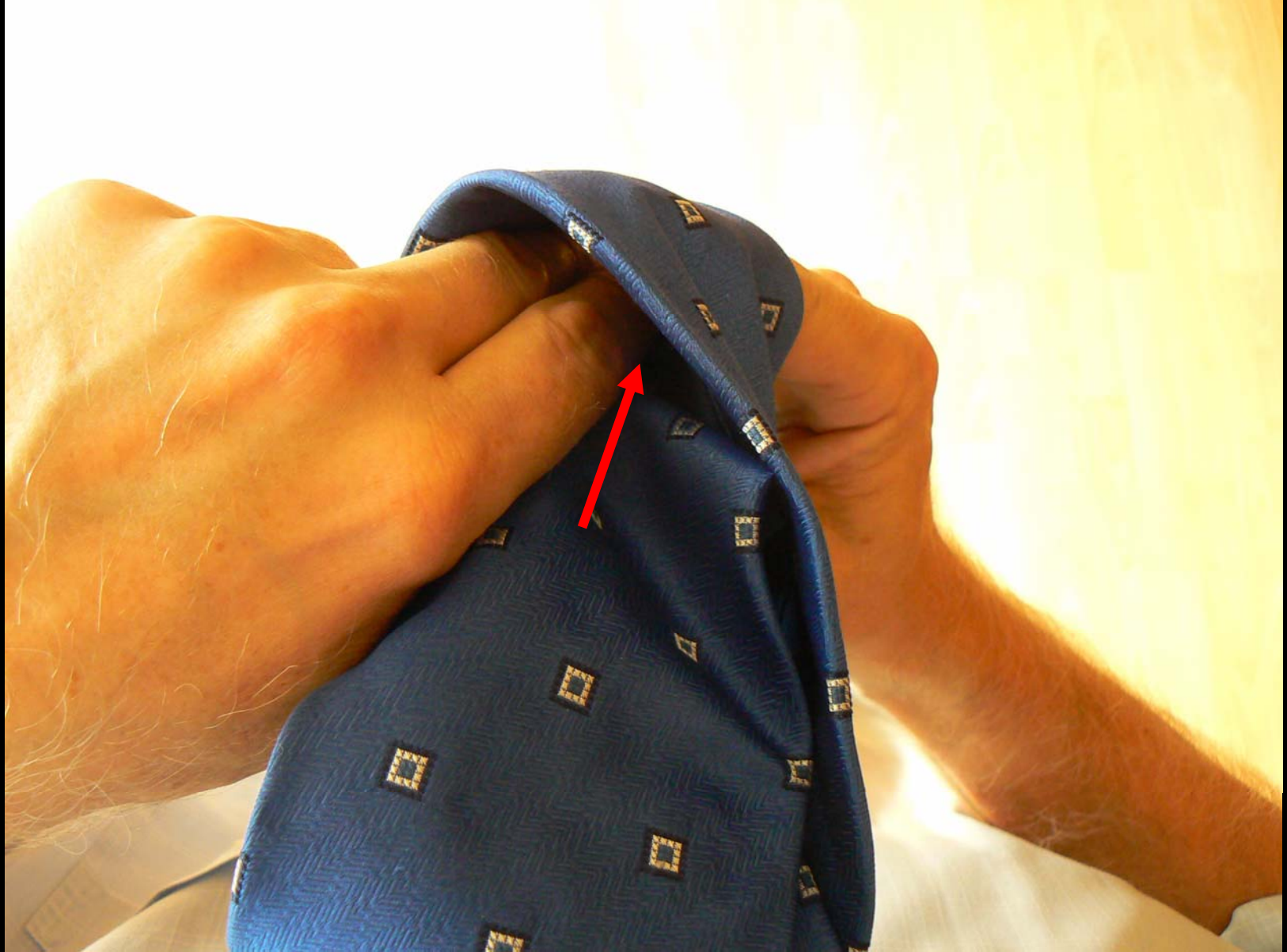
Uzel Manhattan - provlékání širšího konce (snímek č. 8)