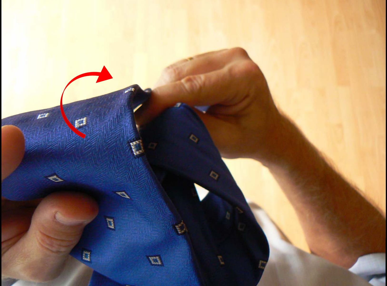
Uzel Manhattan - provlékání širšího konce (snímek č. 7)