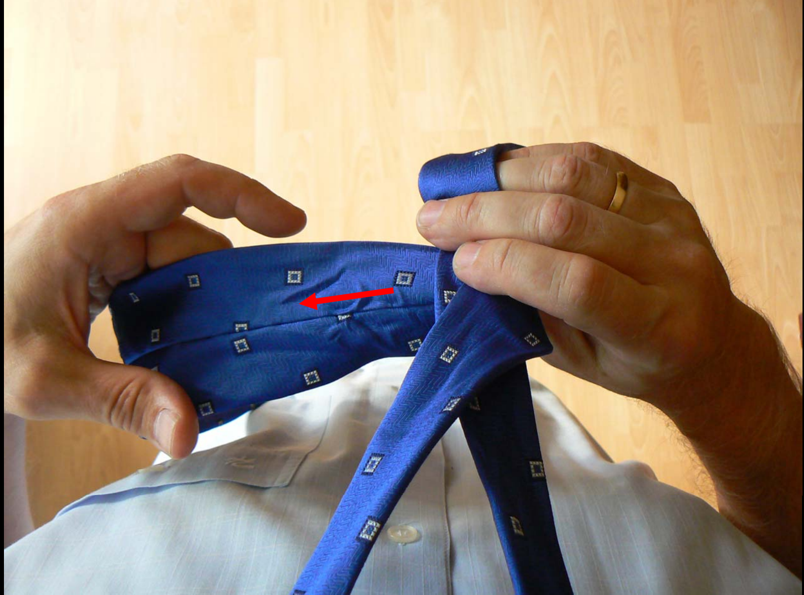
Uzel Manhattan - základ uzlu, podpora křížení pravou rukou (snímek č. 3)