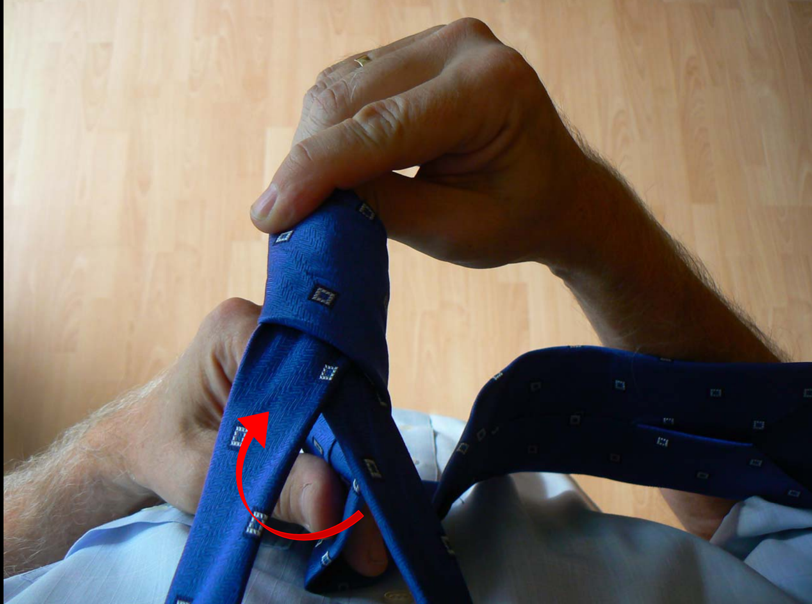
Uzel Manhattan - podvlečení dopředu (snímek č. 5)