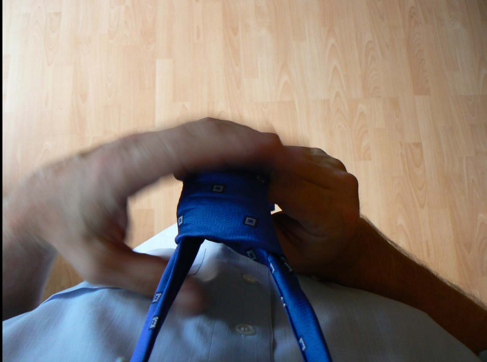
Uzel Manhattan - hotový uzel (snímek č. 11)