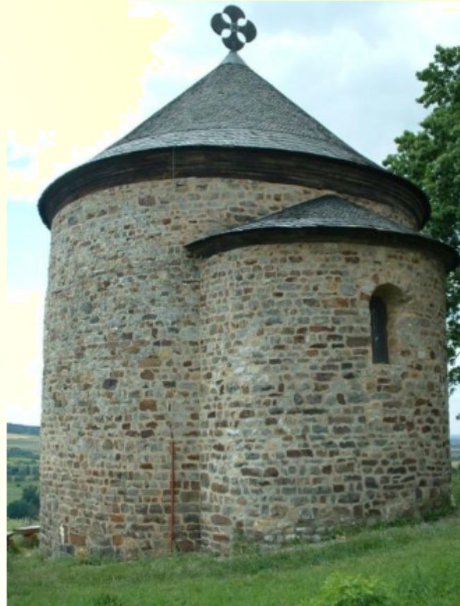
ROTUNDA SV. PETRA A PAVLA