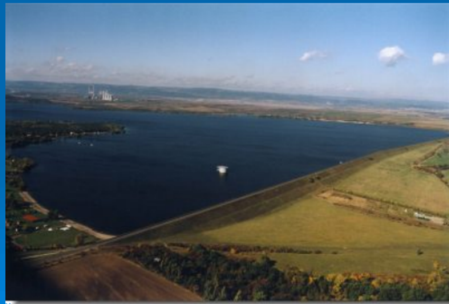
Vodní nádrž Nechanice