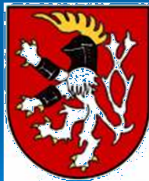
Znak krajského města