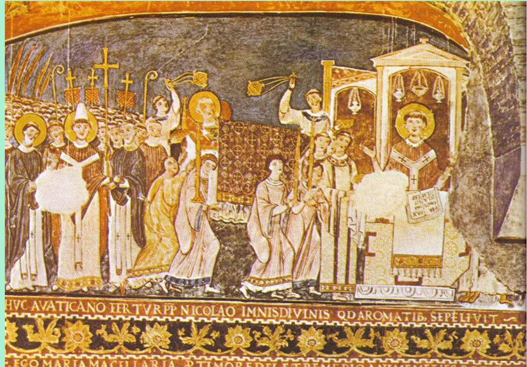
Přijetí bratrů u papeže v Římě