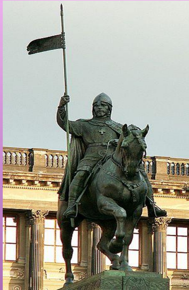
Socha od J. V. Myslbeka – Václavské náměstí v Praze