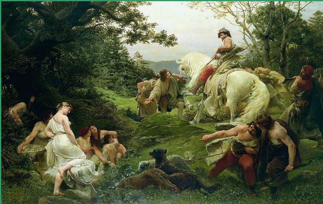
Obraz : Oldřich a Božena František Ženíšek