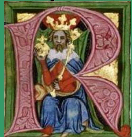
Miniatura ze Zbraslavské kroniky