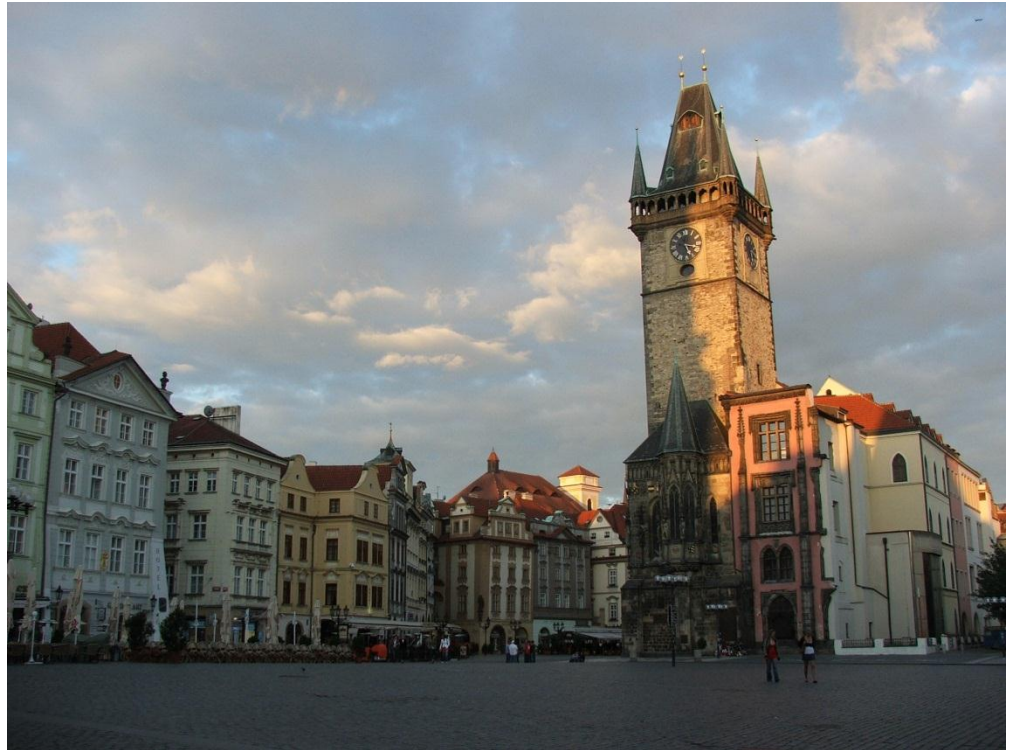
Staroměstské náměstí s orlojem