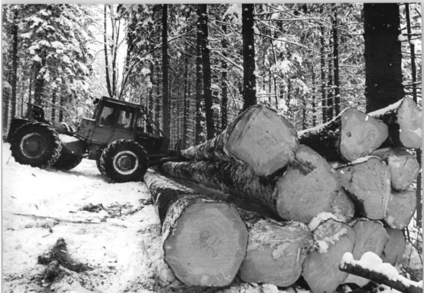
14. Januar 1985