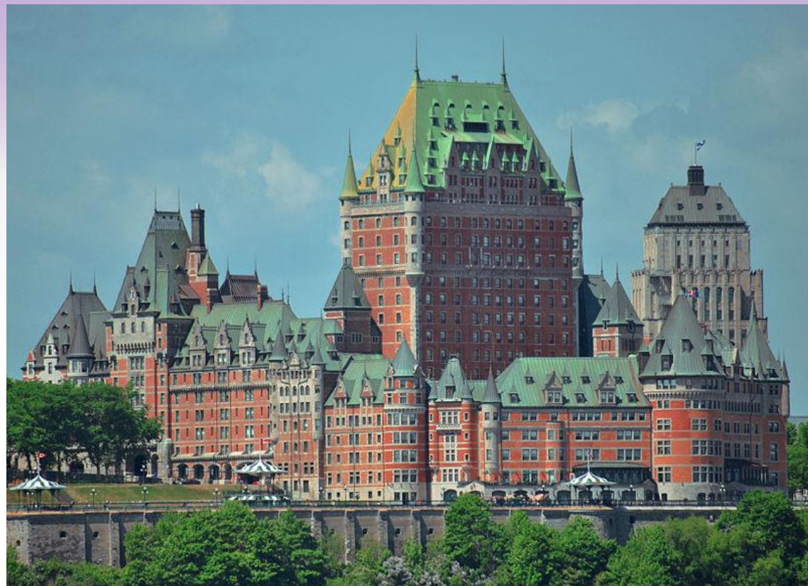
Le château Frontenac à Québec