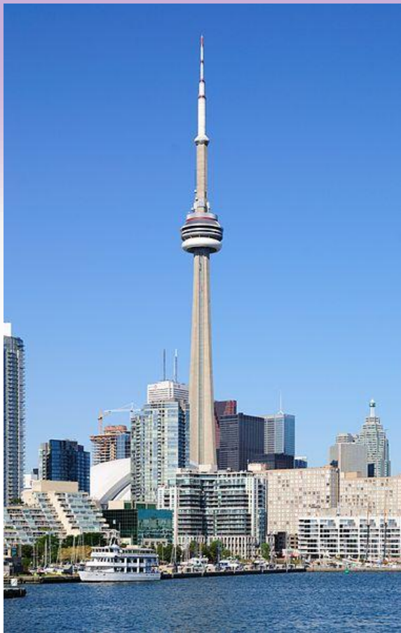
La tour CN - Toronto