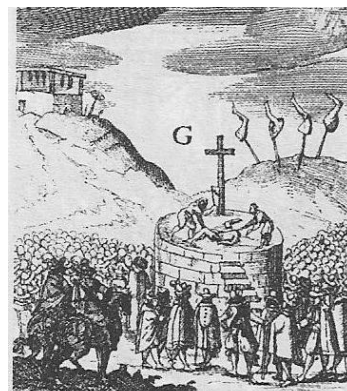
Ani mrtvý dr. Jesenský neměl ještě klid. Jeho tělo pacholci téhož dne vyvezli za Horskou bránu – stála v místech, kde je dnes mimoúrovňová křižovatka U Bulhara – a tam bylo rozčtvrceno. Drsný obrázek je volnou dobovou fantazií anonyma.