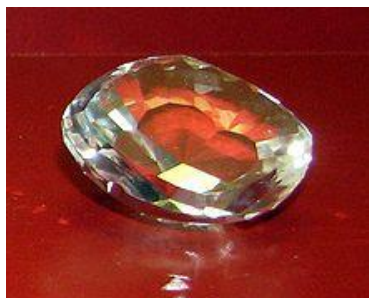
Skleněná replika diamantu Koh-i-Noor

Koh-i-Noor, též Koh-i-noor, Kohinoor, Koh-e Noor nebo Koh-i-Nur (český překlad je Hora světla) je diamant o hmotnosti 105 karátů (21,6 gramů). Je součástí Britských korunovačních klenotů.