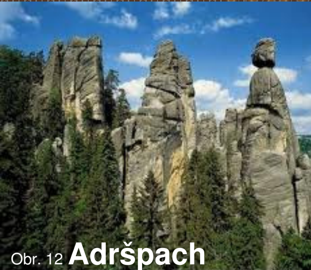
Obr. 12 Adršpach