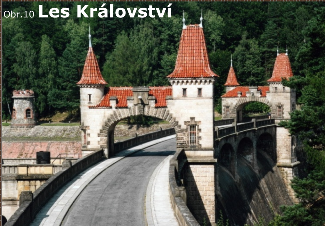
Obr.10 Les Království

Energetika - přehrada Les Království na Labi