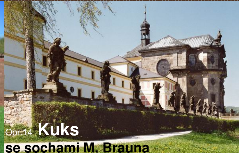
Obr.14 Kuks se sochami M. Brauna