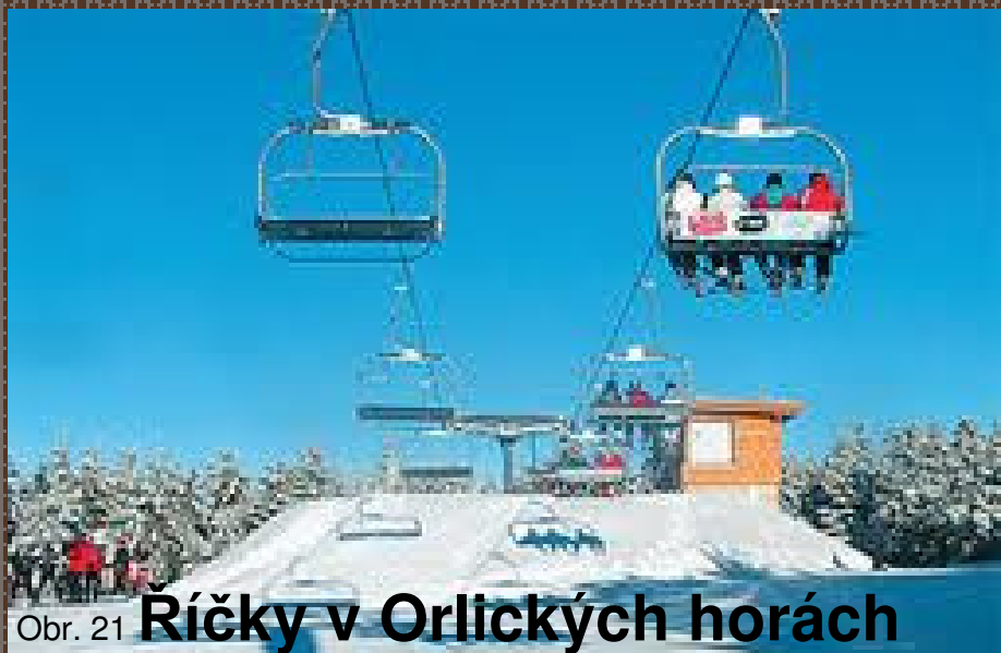
Obr. 21 Říčky v Orlických horách